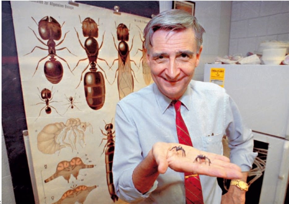
Nowak-Mitstreiter Edward O. Wilson Der Nestor der Soziobiologie teilt die Kooperationsthese

„Nach vier Jahrzehnten ist es an der Zeit, dass wir erkennen, wie limitiert das Standardmodell ist“ Edward O. Wilson, Soziobiologe